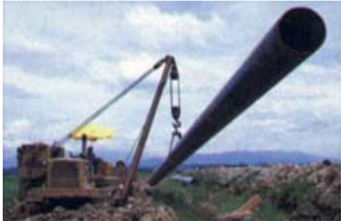
Tubulações/outras estruturas isoladas