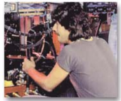
Tecnologia e manutenção